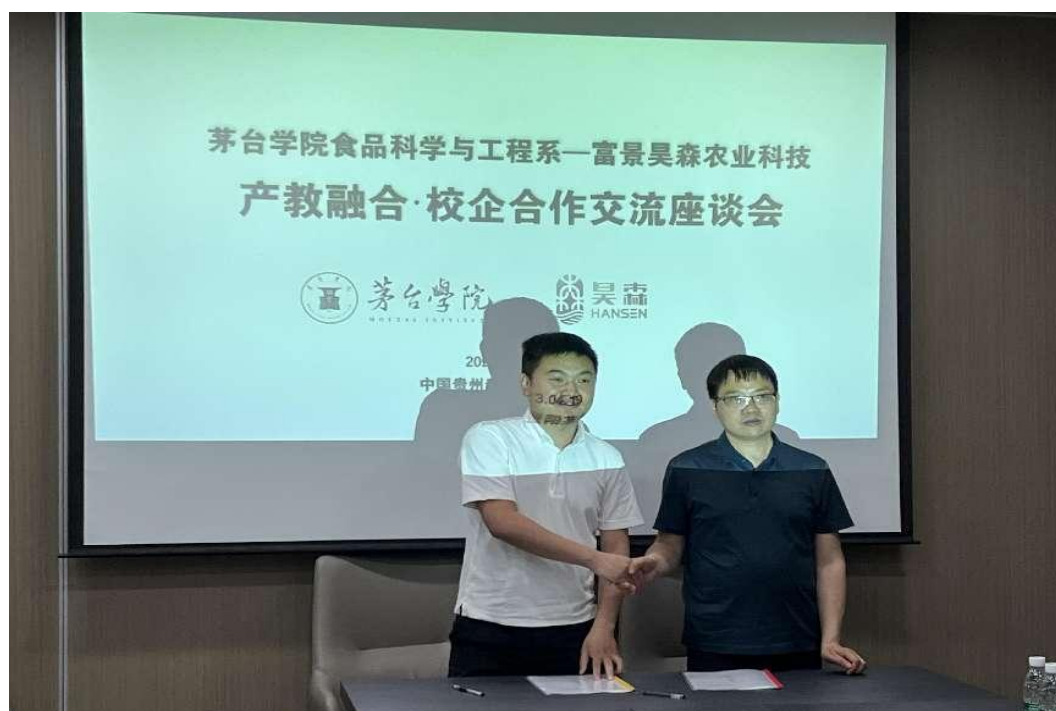
(食品科学与工程系)

会上，与会双方还就建立产学研合作基地，实施产教融合、校企协同发展，科研协作与科技攻关、农业成果转化和科技服务、企业技术人才培养、校企合作参与创新创业大赛、合作建设工厂检测实验室等方面进行深入交流。