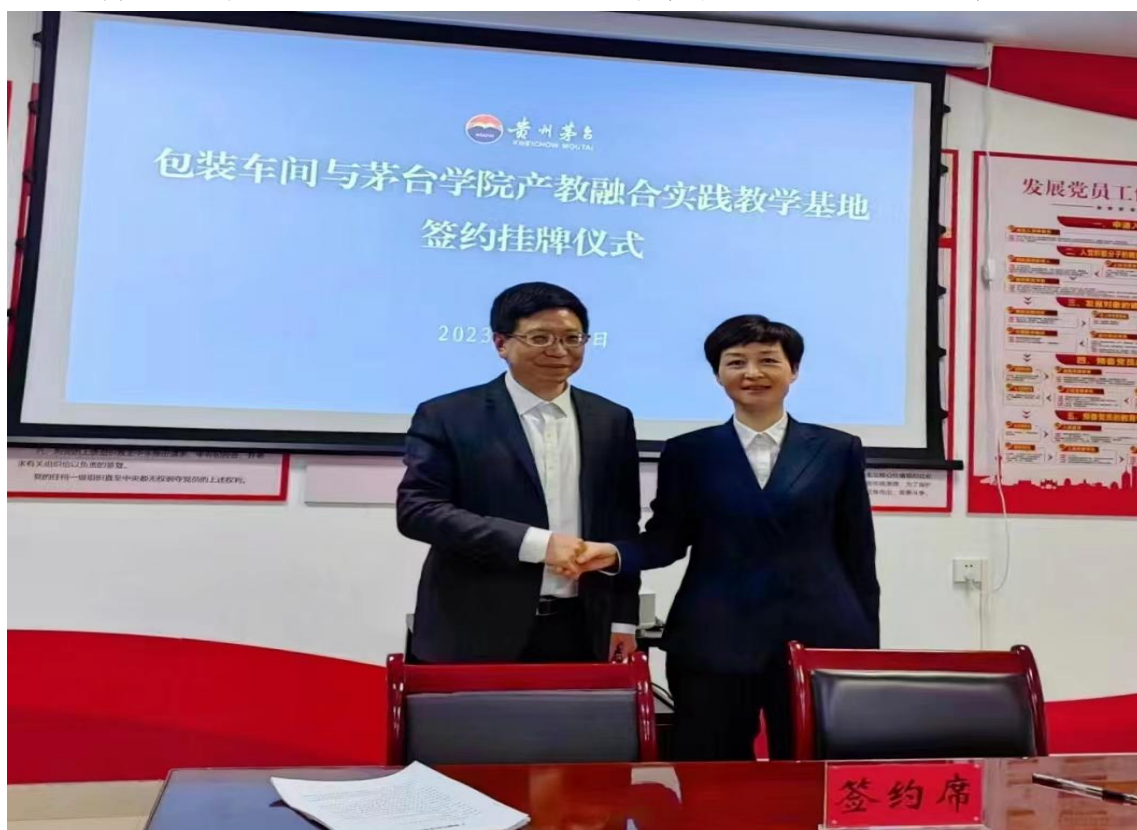
(酿酒工程自动化系)

校企合作进一步推动学校产教融合、人才培养模式向纵深发展，为学校培养出更多厚基础、强实践的高素质应用型人才打下坚实基础。