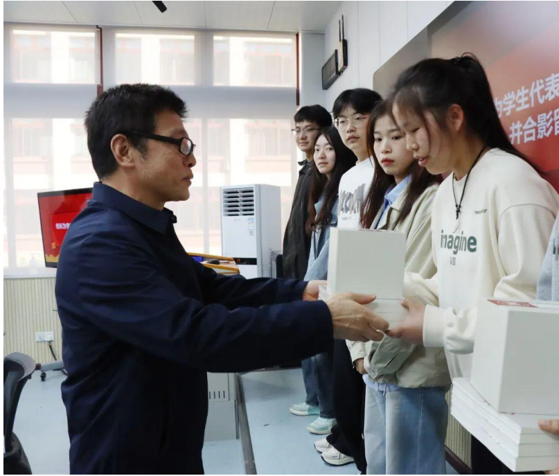
茅台学院校长蔡绍洪为学生颁发纪念品