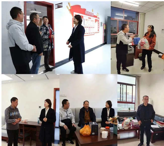
慰问其他老专家、老教授