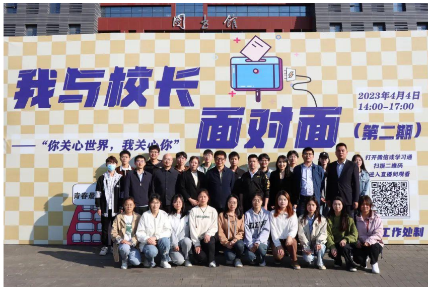
相关单位主要负责人、各系学生代表参加活动。